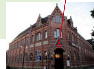
Teeken- en Ambachtsschool